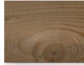
Äste in der charaktervollen Oberfläche

Sofern diese im Gehbereich auf Bodendielen oder an optisch wichtigen Stellen auftreten, können Sie diese zum Beispiel mit einem Stechbeitel entfernen.