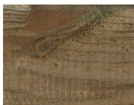
Raue Stellen auf der Oberfläche

Mit einem Tuch oder einer Wurzelbürste können diese „Schönheitsflecken“ nach dem Trocknen des Holzes entfernt werden. Tipp: Sprühen Sie die betroffenen Stellen vor der Reinigung mit einem chlorhaltigen Reiniger ein.