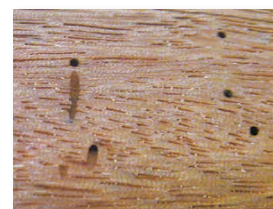
Natürliche Eigenschaften des Hartholzes

Damit Sie ein hochwertiges Produkt erhalten, fertigen wir mit grösstmöglicher Sorgfalt. Doch auch modernste Technik und hochwertige Hobel und Fräser können insbesondere an Rundungen und Kappschnitten, in Astbereichen oder bei quer zur Faserrichtung des Holzes verlaufenden Bearbeitungen das Auftreten von rauen Stellen auf der Holzoberfläche nicht verhindern! Wir bitten Sie, diese Stellen ggf. eigenhändig nachzuarbeiten.