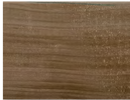
Unterschiedliche Farbspiele auf dem Holz

Bei der Kesseldruckimprägnierung werden zum Schutz der Holzoberfläche Salze in das Holz gepresst. Diese Imprägniersalze reagieren mit Holzinhaltstoffen und können an einigen Stellen „ausblühen“. Diese ungefährlichen, grünlichen Salzkristallisierungen verblassen im Laufe der Zeit.