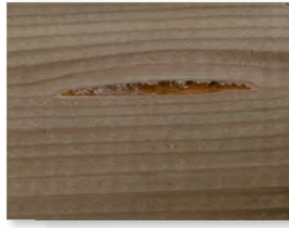
Harzaustritte oder Harzgallen

Dies ist eine natürliche Erscheinung des Werkstoffes Holz, kann daher von uns bei der Herstellung nicht ausgeschlossen werden und stellt keinen Mangel dar*.