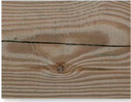
Spannungsrisse durch die Holz-trocknung

Holz ändert durch klimatische Einflüsse und die dadurch bedingte Aufnahme und Abgabe von Wasser seine Dimensionen.