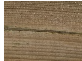
Dunkle Stellen auf der Oberfläche

Holz ist ein Naturprodukt. Da ist es verständlich, dass unterschiedliche Partien auch unterschiedliche Farben aufweisen. Aber auch auf einem einzelnen Stück Holz stellen unterschiedliche Farbnuancen keinen Reklamationsgrund dar. Die Farbunterschiede begründen sich zum Beispiel in der Pigmentierung des Holzes. Im Laufe der Zeit gleichen sich die Stellen jedoch durch Witterungseinflüsse farblich an.